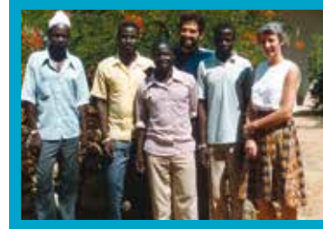
Die Übersetzer mit einer Beraterin im Jahre 1986

1981 wurde das Markusevangelium veröffentlicht und schnell zogen diese Texte in der geläufigen einheimischen Sprache großes Interesse auf sich. Für die zahlreichen Christen, die Zulgo lesen lernen wollten, startete ein Alphabetisierungsprogramm. 1989 wurde das NT zum ersten Mal mit einer Auflage von 1000 Exemplaren herausgegeben. Sieben Jahre später war eine Neuauflage von 1000 Exemplaren notwendig. Dann wurde im Jahr 2011 eine Hörversion aufgenommen. Die ersten beiden Auflagen des NTs sind bereits vergriffen, was die Lebendigkeit der christlichen Gemeinde in diesem Volk beweist. So wurden wir letztes Jahr von einem schweizerischen Missionar im Ruhestand darauf angesprochen, eine weitere Auflage von 1000 Exemplaren zu organisieren. Die Finanzierung